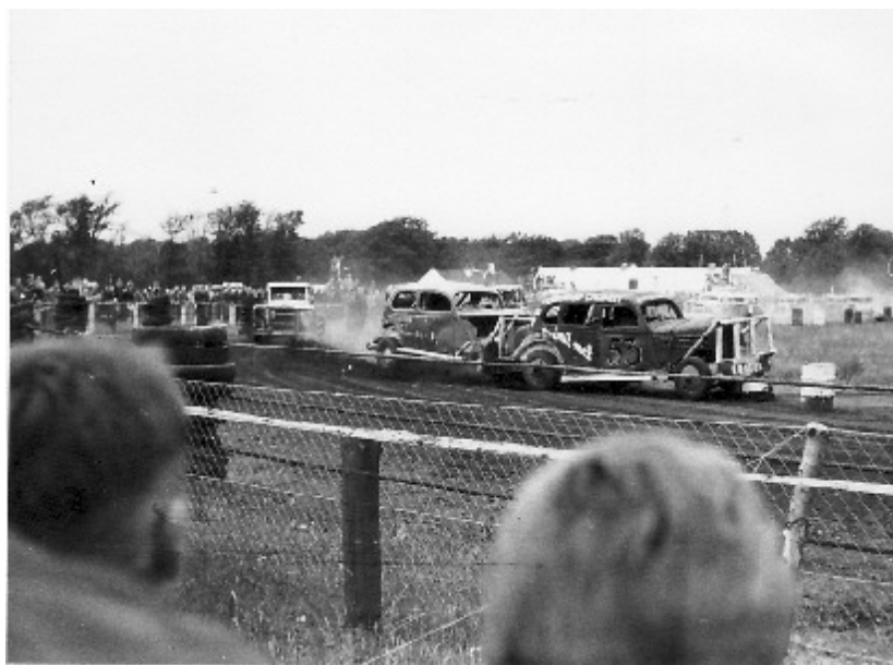
Skrammelløb i august 1956

Morskaben for publikum kunne være stor, men den sportslige værdi var det bestemt ikke. En slags motorsportens fribrydning som også andre baner viste for at pynte på et dalende tilskuertal.