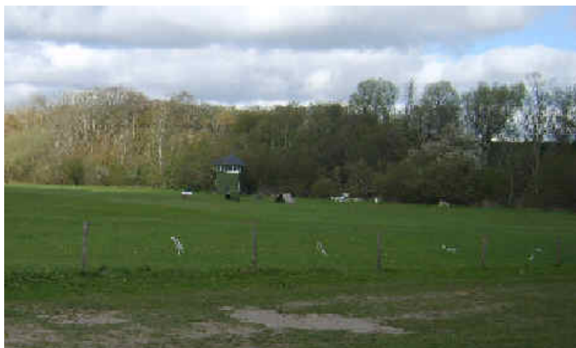
Lindholm banen i øjenhøjde 2010

Aalborg Amtsavis bragte d. 21. august 1950 denne overskrift på et referat af løbene på Lindholm dagen før.